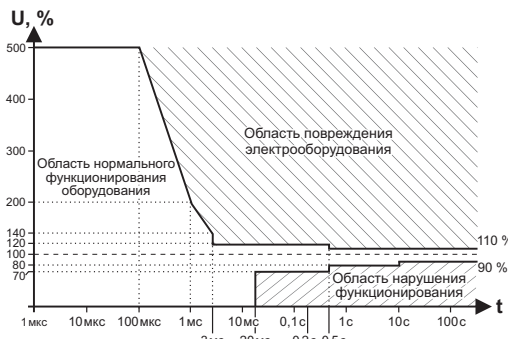
Рис. 1. Кривая работы электрооборудования ITIC (CBEMA), ( http://www.home.agilent.com/upload/cmc_upload/All/1.pdf?&cc=UA&lc=eng ).